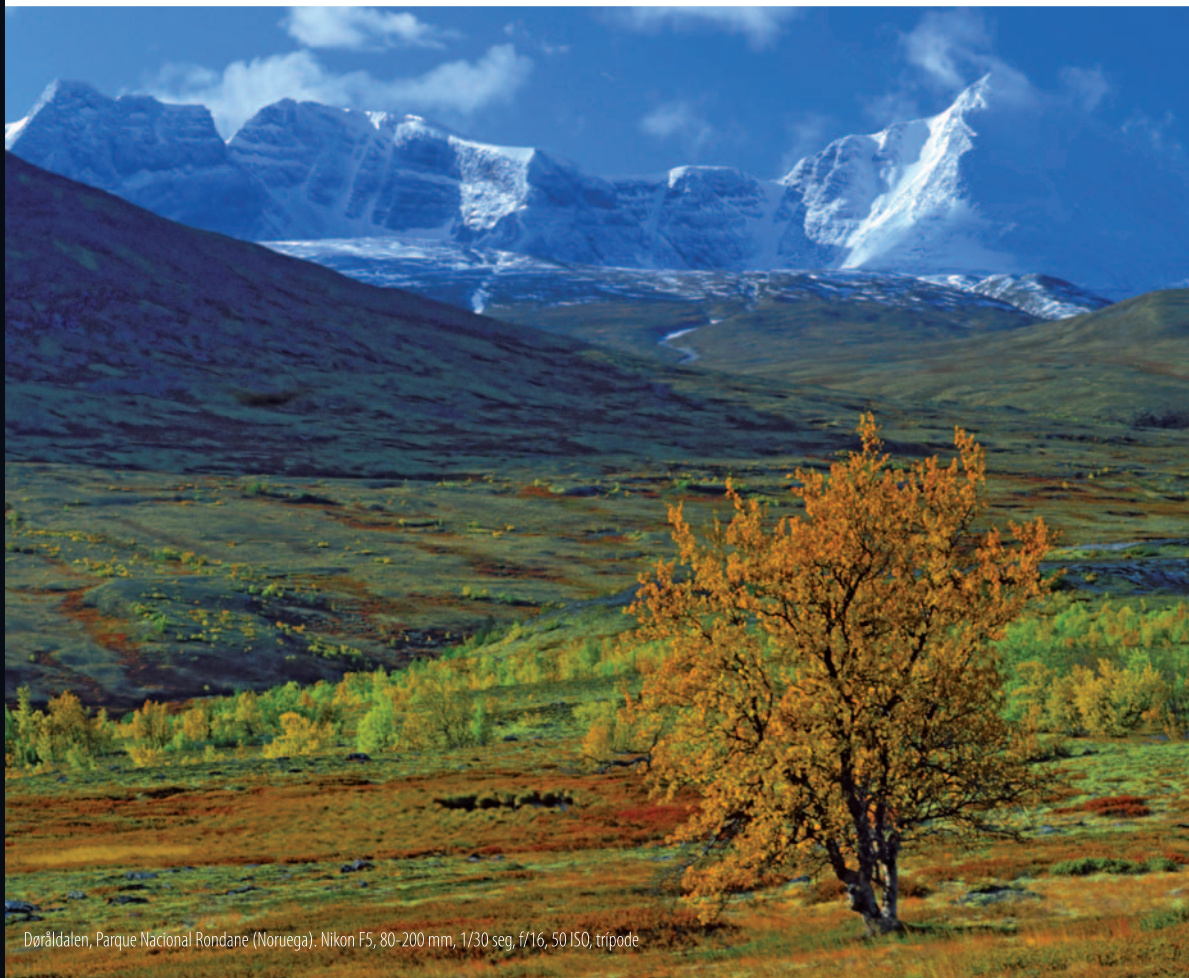
Doråldalen, Parque Nacional Rondane (Noruega). Nikon F5, 80-200 mm, 1/30 seg, f/16, 50 ISO, trípode