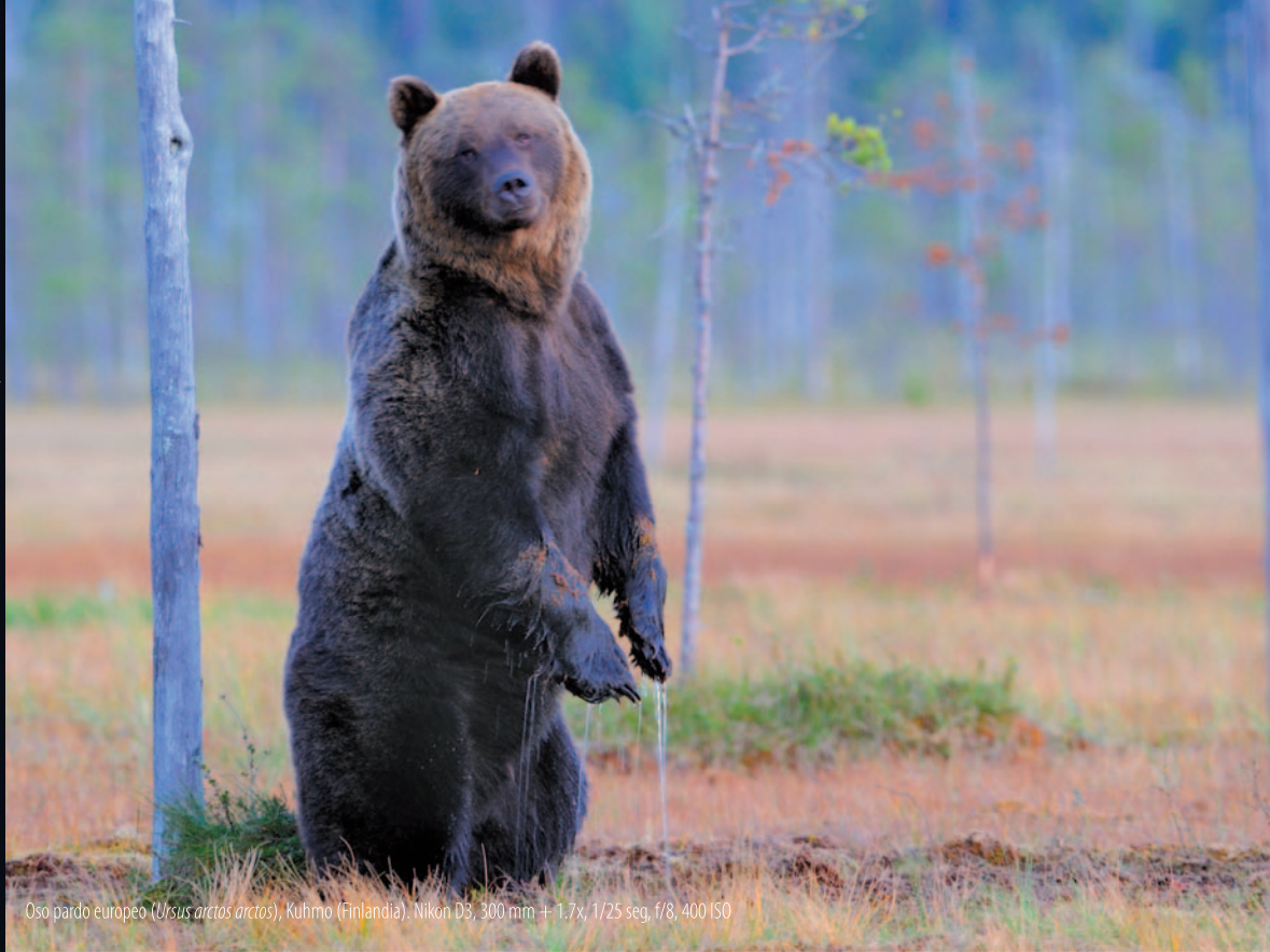
Oso pardo europeo ( Ursus arctos arctos ), Kuhmo (Finlandia). Nikon D3, 300 mm +1.7x, 1/25 seg, f/8, 400 ISO