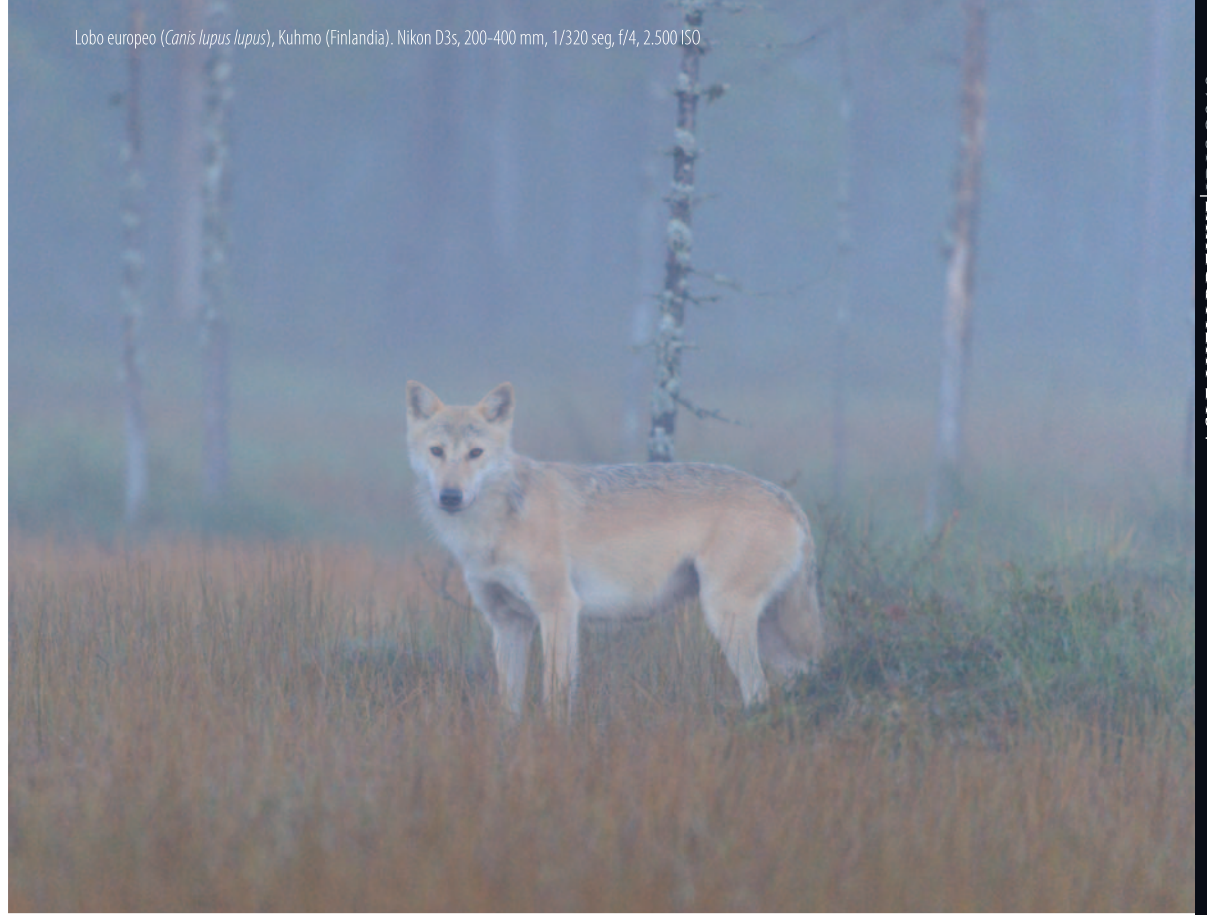
Lobo europeo ( Canis lupus lupus ), Kuhmo (Finlandia). Nikon D3s, 200-400 mm, 1/320 seg, f/4, 2.500 ISO