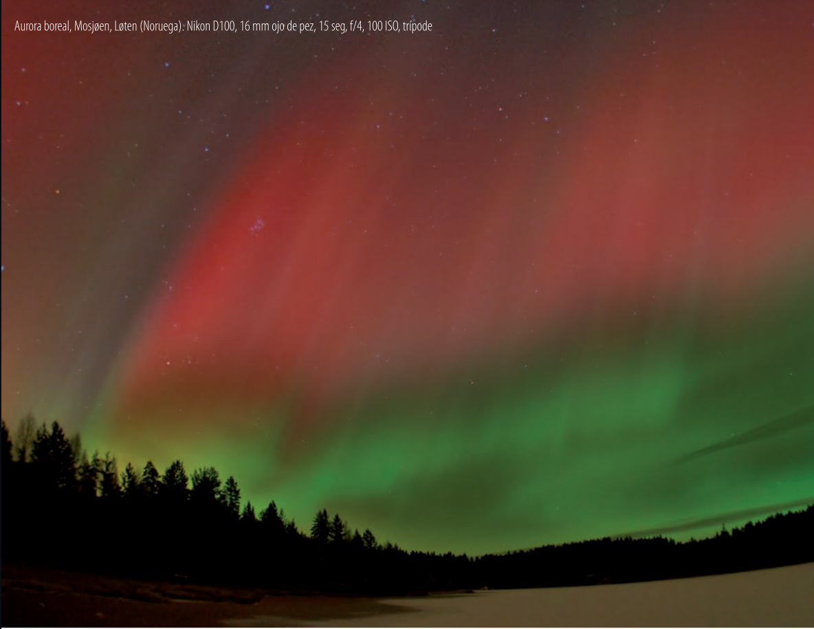
Aurora boreal, Mosjøen, Løten (Noruega). Nikon D100, 16 mm ojo de pez, 15 seg, f/4, 100 ISO, trípode