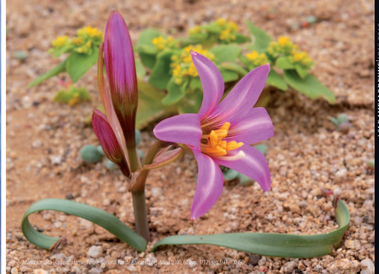
Añañuca rosada ( Radophila laera ), Parque Nacional Pan de Azúcar (Chile). Nikon D100, 60 mm, 1/125 seg, f/11, 100 ISO