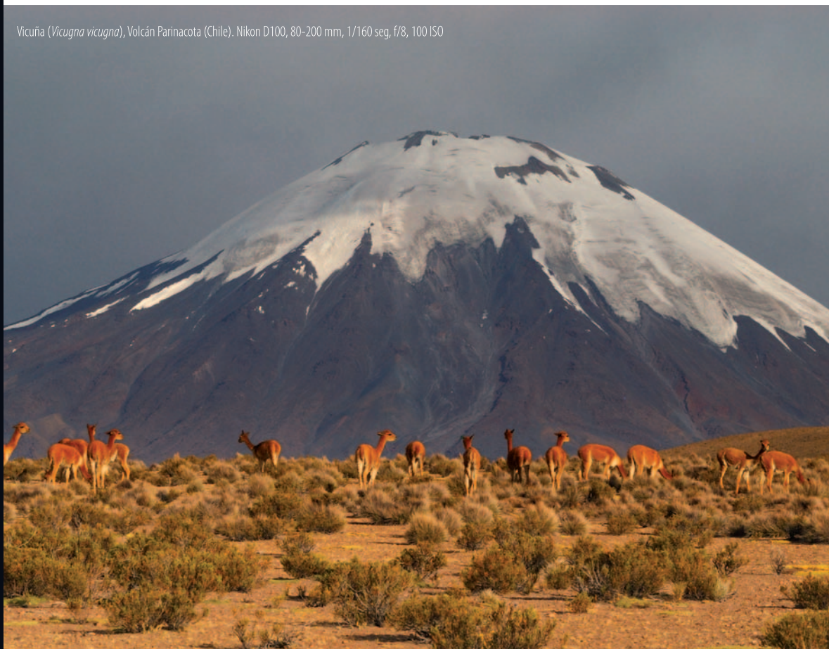
Vicuña ( Vicugna vicugna ), Volcán Paríncota (Chile). Nikon D100, 80-200 mm, 1/160 seg, f/8, 100 ISO