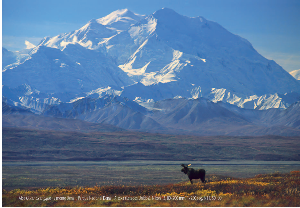
Alce ( Alces alces gigas ) y monte Denali, Parque Nacional Denali, Alaska (Estados Unidos). Nikon F3, 80-200 mm, 1/250 seg, f/11, 50 ISO